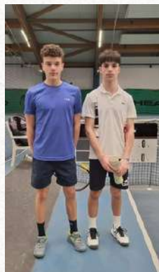
Tableau Garçons U18

Vainqueur – Tournoi de Carnaval 2024 du TC Spora