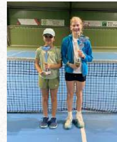
Tableau Filles U12

Finaliste – Tournoi Jeunes Leopold Szymczak du TC Schifflange