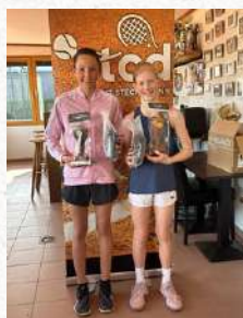
Tableau Filles U12

Finaliste – 1. Outdoor Tournoi de la saison 2024 du TC Dudelange