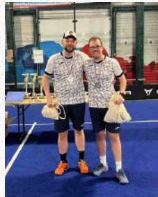
Tableau Catégorie 100

Finalistes – SPORT4LUX – Cupra Padel Tournament