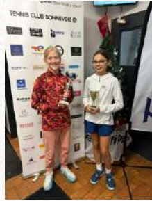
Tableau Filles U12

Finaliste – 3ème Open de Noël by Demy Schandeler du TC Bonnevoie