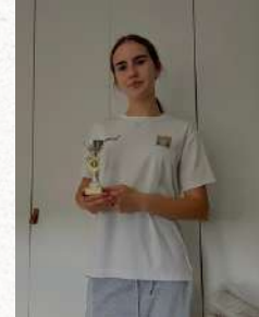
Tableau Filles U18

Finaliste – Tournoi de Carnaval pour Jeunes 2024 du TC Pétange