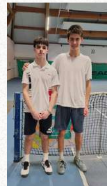
Tableau Garçons U16

Finaliste – Tournoi de Carnaval 2024 du TC Spora