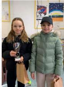
Tableau Filles U12-U14