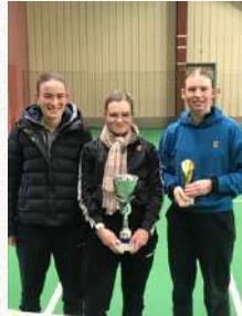
Tableau 2ème Série Dames

3ème Place au TMC de Mont Saint Martin (France)