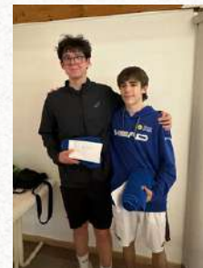
Tableau Messieurs Cat. 4.1

Finaliste – Indoor Nordstad Open 2024 by Garage Deltgen & Origer