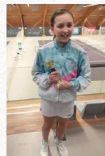
Tableau Filles U12

Vainqueur – Tournoi de Carnaval pour Jeunes 2024 du TC Pétange