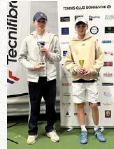
Tableau Garçons U14