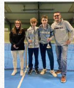
Tableau Garçons U18

Vainqueur – Tournoi Jeunes Leopold Szymczak du TC Schifflange