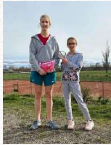
Tableau Filles 4ème Série