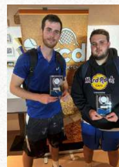
Tableau Messieurs Cat. 5.1

Vainqueur – 1. Outdoor Tournoi de la saison 2024 du TC Dudelange