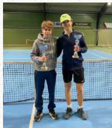
Tableau Garçons U16

Vainqueur – Tournoi Jeunes Leopold Szymczak du TC Schifflange